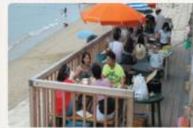
ビーチデッキBBQ 夏季限定6/24~8/31