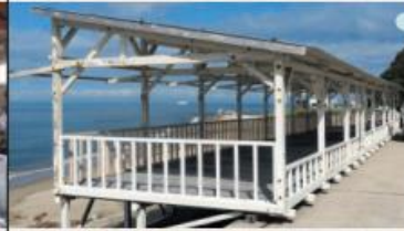
納涼休憩所 夏季限定6/24~8/31