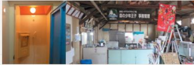
コインシャワー 受付